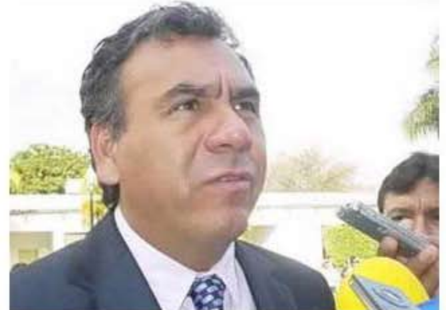
Javier Villarreal Terán, secretario de Turismo de Tamaulipas

Agregó que esta frontera, por su situación geográfica, se convierte en el punto de cruce ideal para mucha gente que va o viene de Estados Unidos, y eso debe ser aprovechado, de allí la importancia de tener una policía cuya misión sea cuidar y ayudar a esos visitantes.